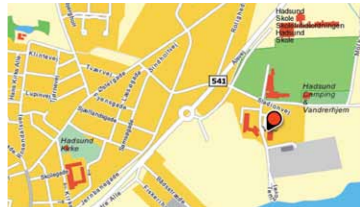
Tech College Mariagerfjord Tempvej 3, 9560 Hadsund