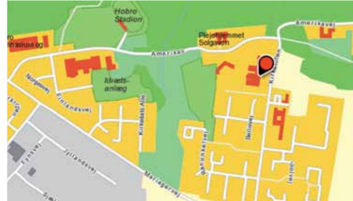
Tech College Mariagerfjord Kirkegårdsvej 5, 9500 Hobro